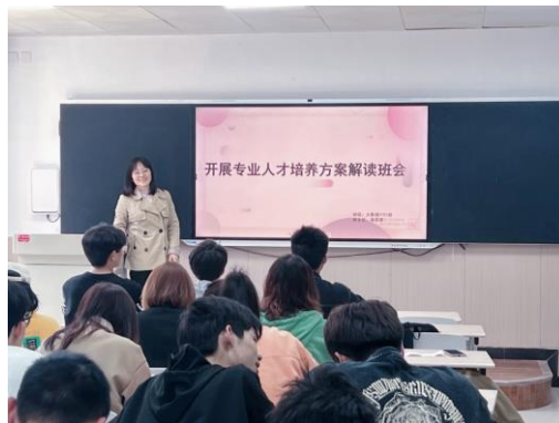
人文与教育学院开展人才培养方案解读专题活动