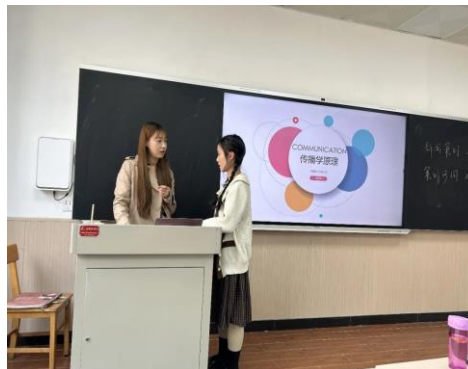
网络与新媒体 2103 班开展《传播学原理》特色活动