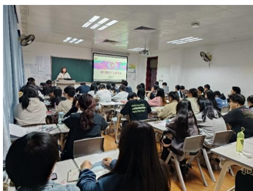
工业设计 2101 班“大广赛”宣讲会