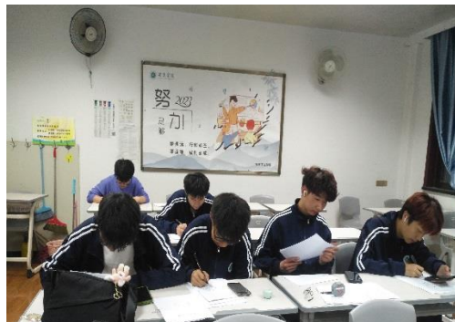
机械设计制造及其自动化2201学风建设班会 电气工程及其自动化2201班学风建设讨论会