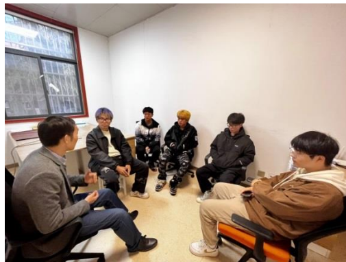
电气工程及其自动化专业 2102 班谈心谈话 智能制造工程 2201 班谈心谈话