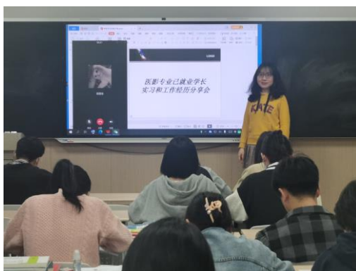
医学影像技术专升本 2210 班开展就业求职讲座

计算机学院班主任李盼、路文华、尼涛分别邀请企业讲师在所带班级开展就业形势讲座，帮助学生对未来就业进行规划。