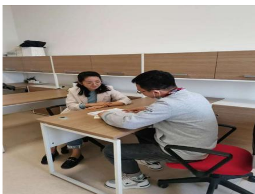
电子信息学院开展一对一帮扶活动

传媒学院班主任组织开展学生学业评析与发展指导，对成绩优异学生进行表彰及经验分享；对成绩不佳的同学进行思想教育和帮扶。