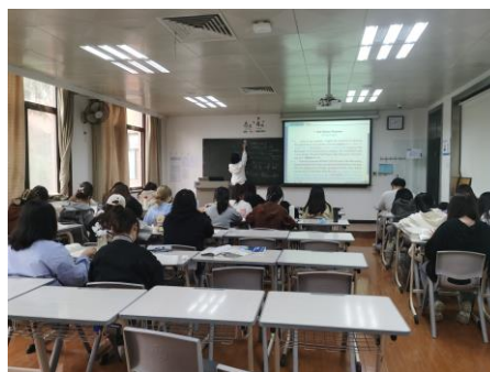
人文与教育学院英语 2101 班班主任姜薇组织开展读书分享活动