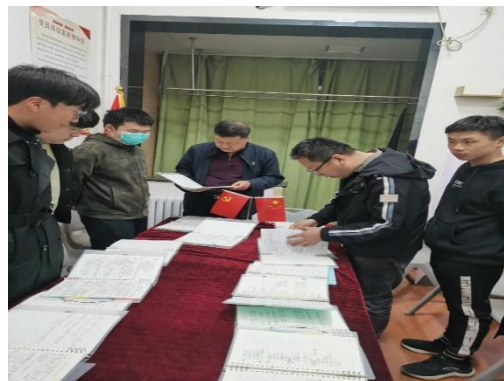
机械工程学院笔记评选