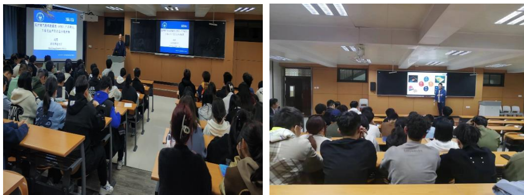
电子信息学院开展学术报告现场