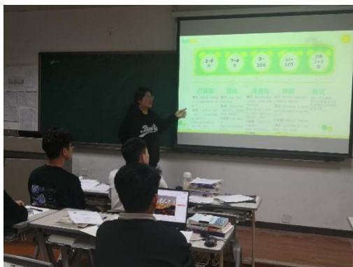
机械工程学院开展学长学姐经验交流会

机械工程学院班主任组织召开学长学习经验交流会共4场。学长们多个方面给同学们进行了分享。