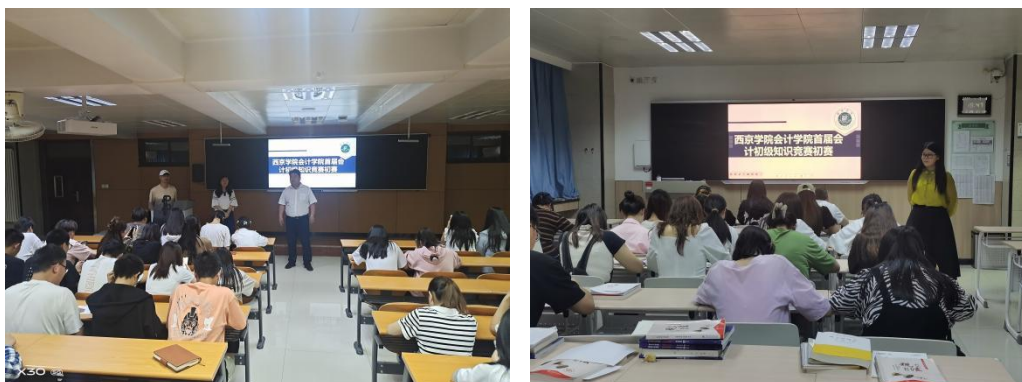
会计学院初级会计知识竞赛

为满足学生对初级会计师资格证考证需要，会计学院筹备举办了首届会计初级知识竞赛。全体班主任参与并开展赛前动员，对《会计实务》《经济法》两门考试科目进行辅导答疑，会计学院21、22级共1300名学生参加此次培训及比赛，覆盖面达100%。