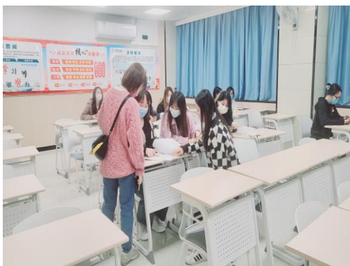
广播电视编导 2203 班学业评析优秀生表彰 网络与新媒体 2104 班学业警示学生辅导现场