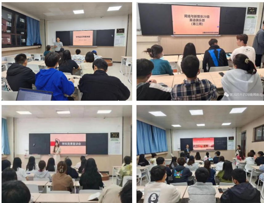
传媒学院“十个一”工程推进学风建设

一是辅导员与班主任就学风建设工作每周进行一次沟通联系。二是每周开展一次英语角活动。三是每周宣传一次学风建设相关活动。四是每月开展一次学科竞赛宣讲交流会。五是每月开展一次学术讲座。六是每月完成一本固定书目阅读和分享。七是成立课程学习小组。八是每月开展一次班级作业和笔记展评活动。九是每月开展一次学习交流分享会。十是每月微信推送宣传一次“榜样力量”。传媒学院期望每月通过“十个一”活动，坚持不懈，形成良好的学习风气和学风管理机制。