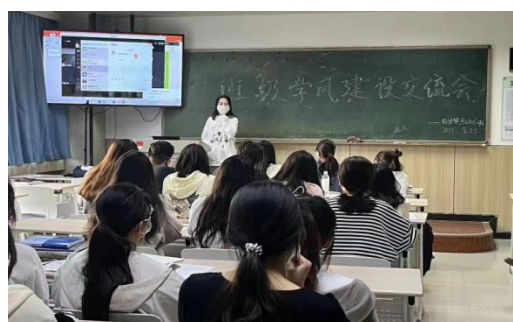
会计学院开展朋辈学习经验交流活动